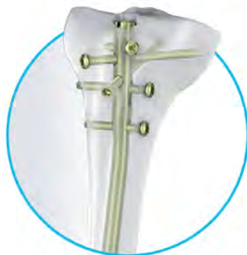
TN-ADVANCED™ Tibial Nailing System