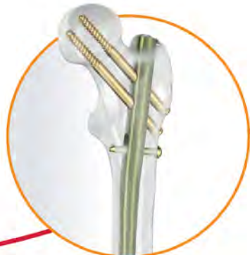
FRN-ADVANCED™ Femoral Recon Nailing System

SOLUTIONS FOR THE SIMPLE TO THE COMPLEX 1-5