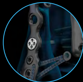
Knotless TightRope® Syndesmosis