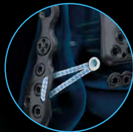
AITFL InternalBrace ™