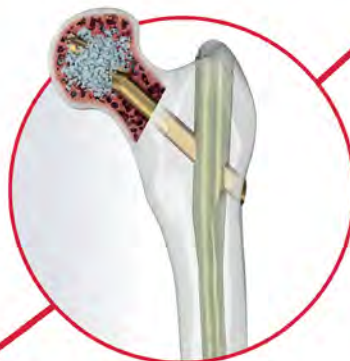
TFN-ADVANCED™ Proximal Femoral Nailing System