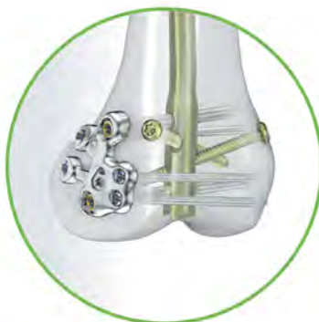
RFN-ADVANCED™ Retrograde Femoral Nailing System